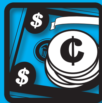
Coste total de propiedad

Presentamos el sistema de fototerapia con LED Lullaby con tecnología LED de vanguardia. Exactamente lo que espera de un sistema basado en la plataforma Lullaby: Porque todos los bebés merecen los mejores cuidados.