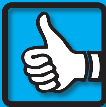
Fácil de usar