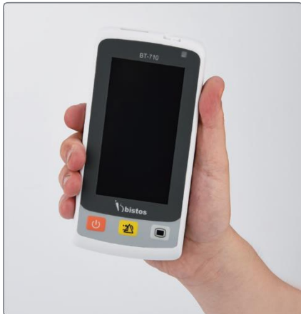
Tamaño de mano