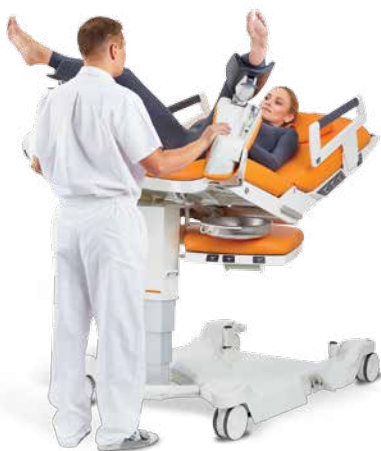
Reparación del perineo