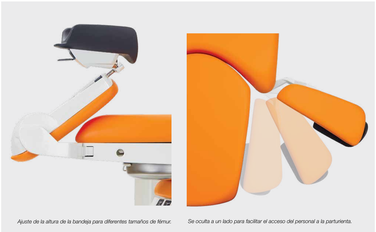
Ajuste de la altura de la bandeja para diferentes tamaños de fémur.