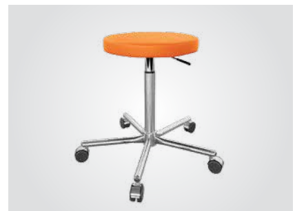
Taburete del médico