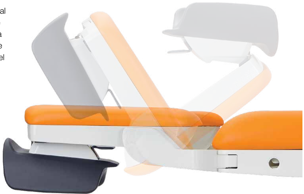
Ajuste rápido de los soportes de piernas en la posición requerida.

La firme concepción de los soportes de piernas permite al equipo médico responder de manera muy rápida y eficaz a las diferentes situaciones que se pueden producir durante el parto.