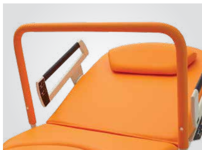
Barra de apoyo tapizada