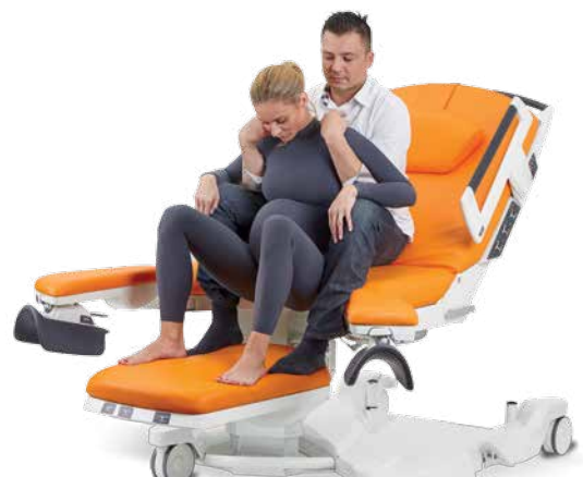
Semisentada con ayuda de la pareja