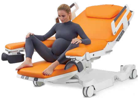
Semisentada usando el apoyapiés