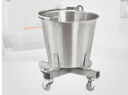
Bandeja de acero inoxidable con ruedas orientables