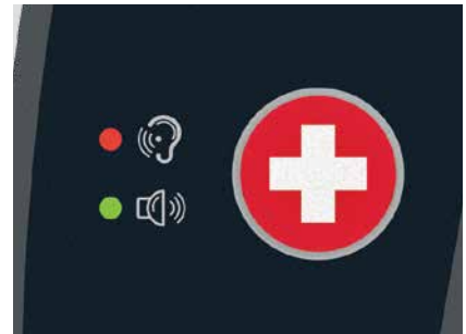
Llamada a enfermería