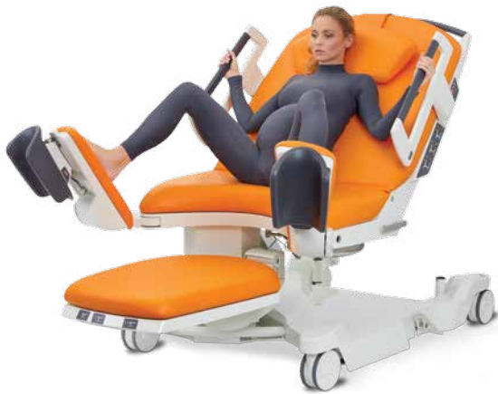
Semirrecostada con los pies apoyados en los soportes de piernas