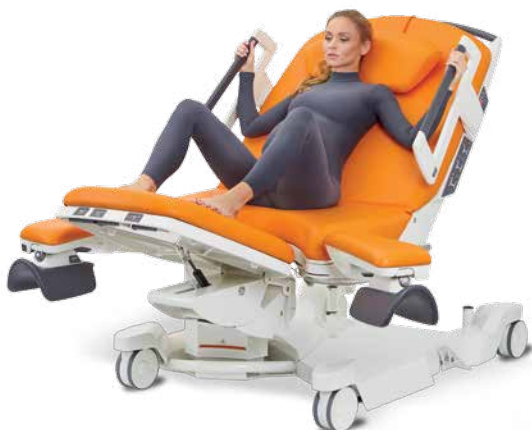
Semirrecostada con los pies apoyados en el apoyapiés