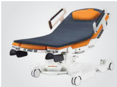
Capa superior del colchón