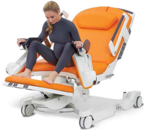
Semisentada usando los soportes de piernas