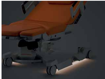
Luz bajo la cama