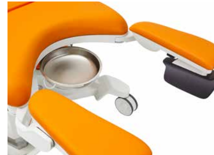
Bandeja deslizable de acero de 4,5 l