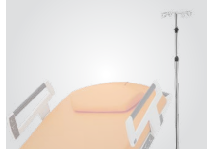
Soporte de infusiones telescópico